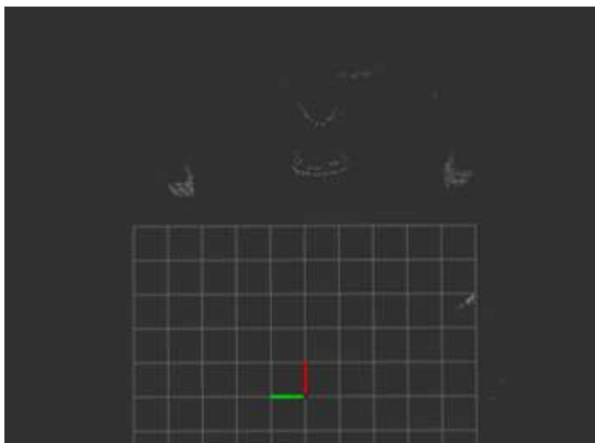
그림 3 알고리즘 적용 이후 데이터